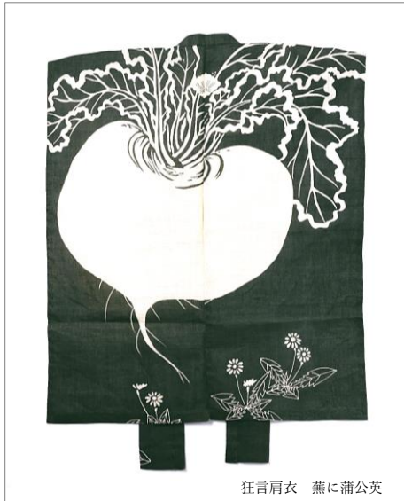
狂言肩衣 蕪に蒲公英